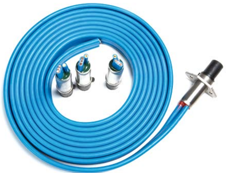
Cavi per pompe sommerse • submersible pump cables