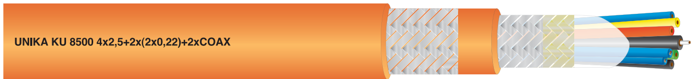
UNIKA KU 8500 4x2,5+2x(2x0,22)+2xCOAX

Cavi di comando, segnalamento, controllo e video sorveglianza, non propaganti l'incendio per piattaforme petrolifere Command, signal, control and video surveillance, not fire propagating for off-shore platforms