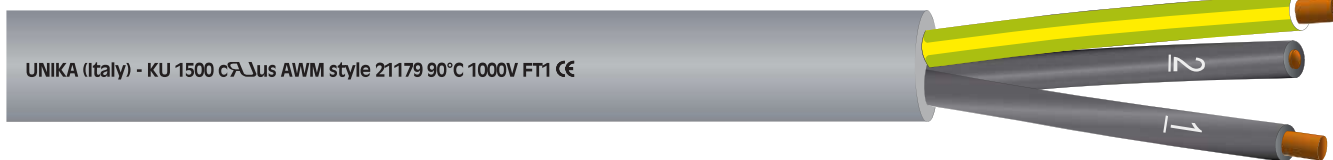
UNIKA (Italy) - KU 1500 cULus AWM style 21179 90°C 1000V FT1 CE

Cavi multipolari comando e controllo, approvati UL e CSA Command and control multi-core cables, UL and CSA approved